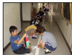
万国旗ロープ付け