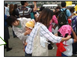
ちゃあびらさいバンダナ結び