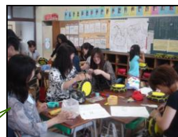
若狭エイサー太鼓作り

皆さん、四苦八苦?!しながらも、完成した太鼓を見て「大事に使ってほしい、頑張って踊ってくれるかな...」との声もあり、丹精込めた思い入れのある太鼓に仕上がっていました。