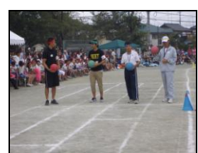
PTA競技 スポーツDEゴー