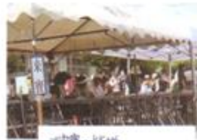
ご来賓の皆様 いつもありがとうございます