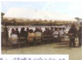
温かい声援ありがとうございます