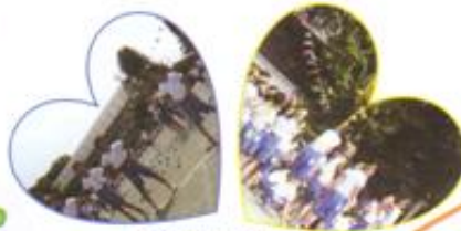
チェッチェコリー