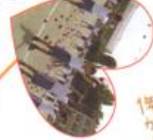
1年生 Dear Michael カワイイ マイケル登場!! King of pop♪