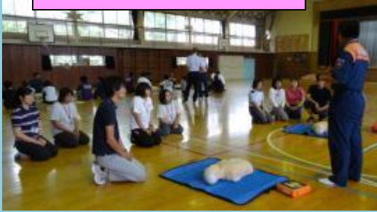
水泳授業が始まりました。職員も救命講習を受けました