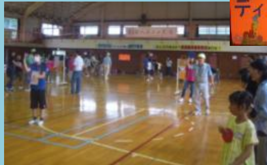
育成会主催のディスコン大会。地域の皆様と楽しく活動できました。