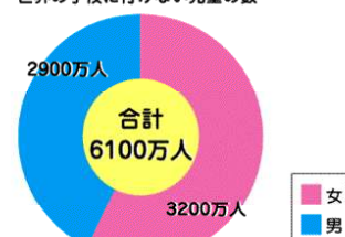
世界の学校に行けない児童の数 ※2

※2 UNESCO (Policy paper 32 / Fact sheet 44 (2017)) 文部科学省資料 (平成29年度)