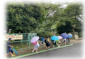
霧雨の中、登校初日となりました。

2学期も、感染対策をしながら、教育活動を継続していきます。引き続き、ご協力をお願いします。