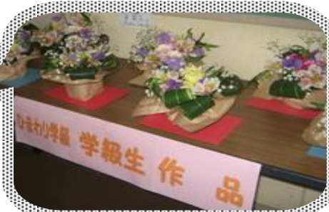
同じ花でも生ける人によって出来上がりが違いました。