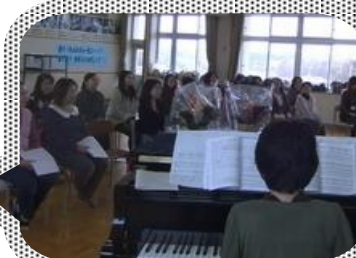
発声の仕方も教わりました。