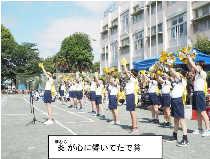
ほむら 炎が心に響いてたで賞