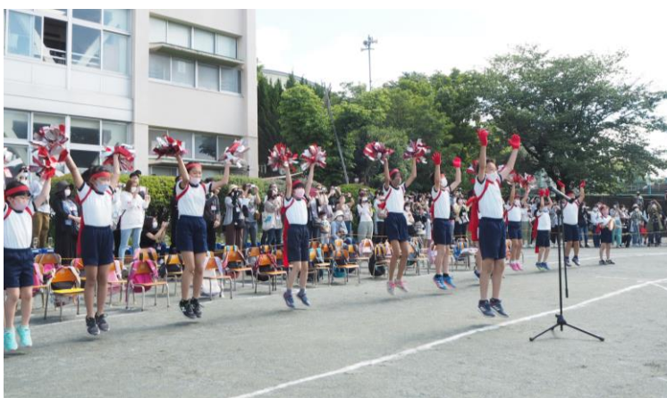
栄光のかけ橋つながったで賞