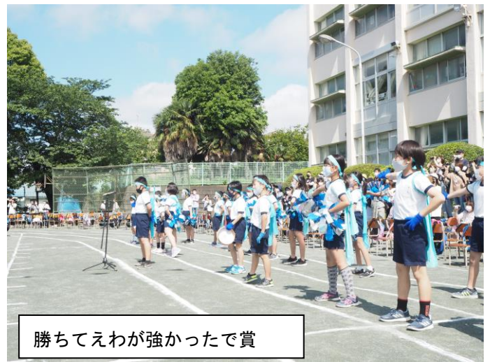
勝ちてえわが強かったで賞