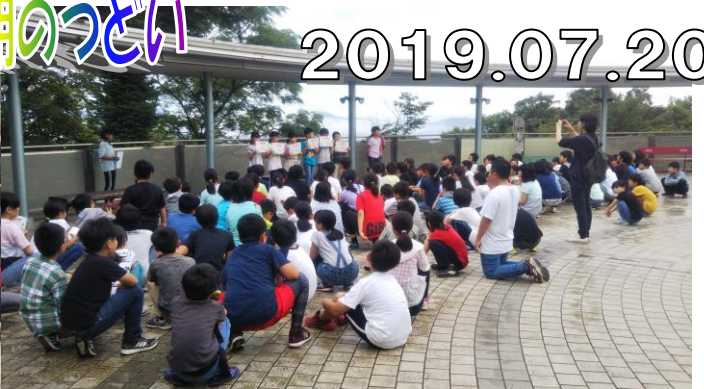
前日のオリエンテーリングの成績発表がありました。