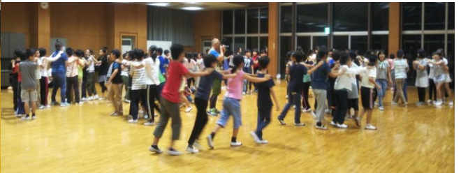
室内で盛り上がりました。