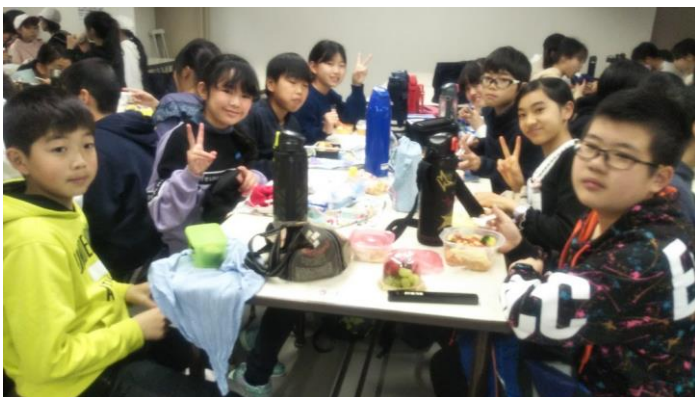
お弁当とてもおいしかったです。