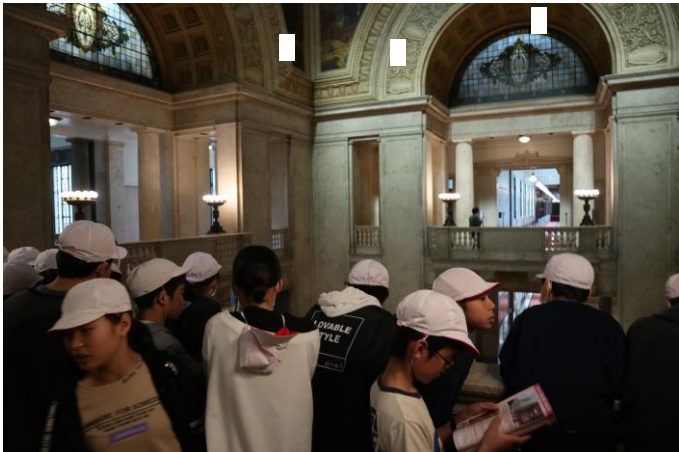
とても立派な建物でした。