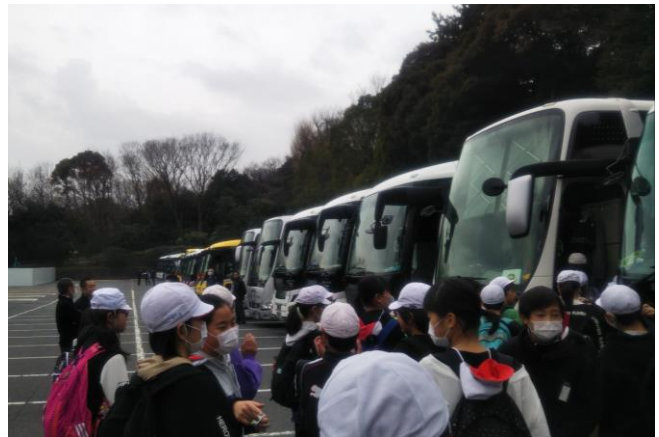
国会も技術館も混んでいました。