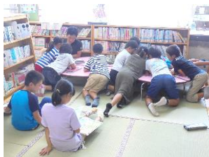
きれいになった畳の上で、読書を楽しむ子供たち

本校愛校会の活動について、地域の皆様、保護者の皆様にご理解・ご賛同をいただいておりますことに心より感謝申し上げます。