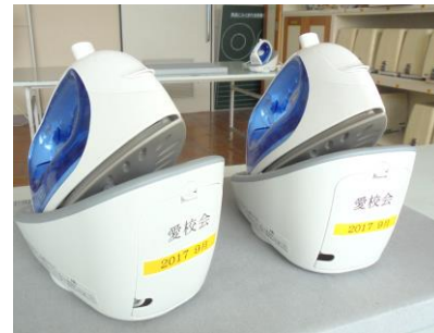
新しいアイロンも購入しました

今年度は、図書室の畳の表替えをさせていただいたり、家庭科室のアイロンの整備をさせていただいたりするなど、子どもたちのために有効に活用させていただいております。表替えしたばかりの畳のいい香りの中、読書する子どもたちの顔はとてもうれしそう！！