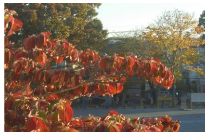
校長室から見える秋の景色