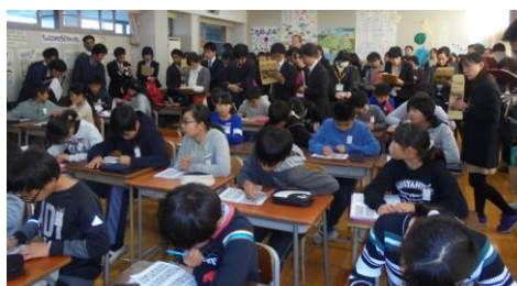
12月12日 外国語活動授業研究会 市内約80名の先生方が参加。英語の教科化に向け、本校職員も頑張っています。