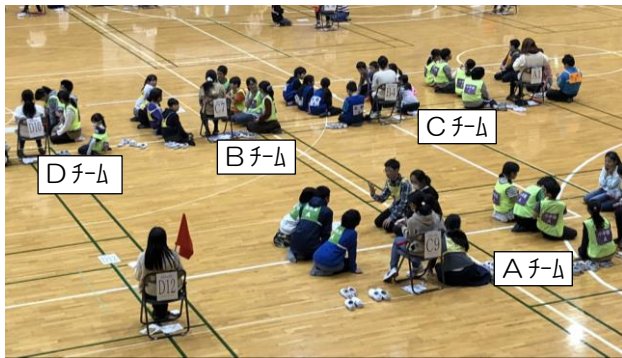
高学年 決勝トーナメント（4 チームもいるぞ）