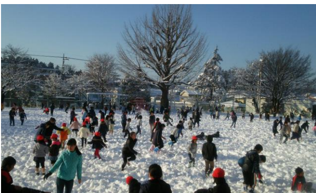
雪で遊ぶ子どもたち