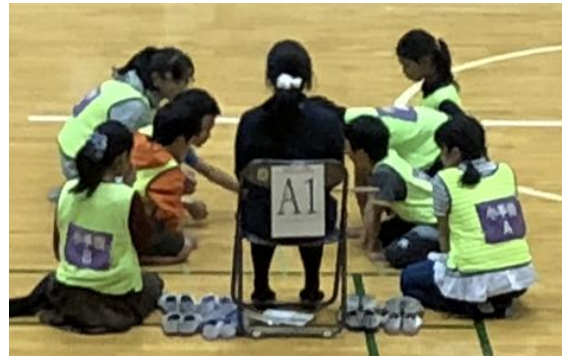
決勝戦 小手指 A vs 小手指 B