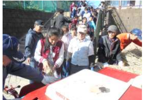
5年生 陸稲の脱穀です

所沢市では「 特色ある学校づくり支援事業 」を展開しています。各学校がそれぞれの地域や環境、人材を活用した教育活動を展開できるよう、予算を付けて支援していただいています。小手指小でも、5年生の陸稲の栽培や、1年生の昔遊び等、数え上げればきりがないうらい地域の方々にお世話になっていますので、所沢市からの特色ある学校づくり予算で、花や球根、苗、肥料などを購入したり、講師の方々への謝礼等にに使わせていただいています。