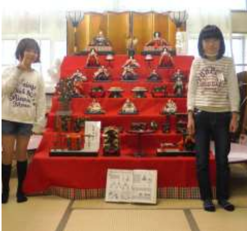
図書室に入った新しい本と 図書室に飾ってあるおひなさま

さらに、PTAの活動として取り組んでいただいている「 ベルマーク 」。お金ではありませんが、集まった点数でいろいろな品物と交換することができます。ベルマーク役員さんにご相談させていただき、小手指小では昨年度から児童用図書に交換しています。今年度も約7万円分のベルマークを集めていただき、新しい本をたくさん購入することができました。上記の特色ある学校づくり予算とは別に所沢市からの図書購入予算も活用していますが、昨年度10万円、今年度7万円と、ベルマークで新しい本がたくさん入ったおかげで、背表紙がカラフルな本が並び、今、図書室はとても華やかです。