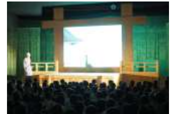
【芸術鑑賞教室】 6月14日体育館 かかし座の影絵