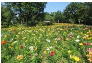
ところざわのゆり園