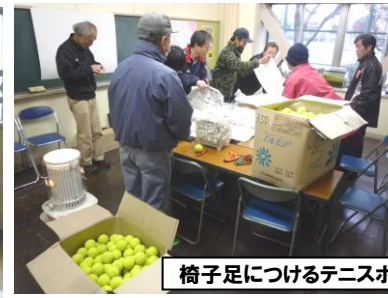
椅子足につけるテニスボールの加工

ましたが、普段なかなかできないところがきれいになりました。ありがとうございました。