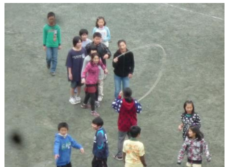
1月中旬昼休み クラス大縄連続跳び練習