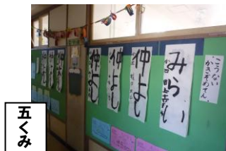
五 く み