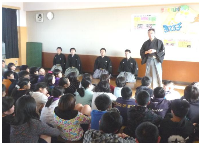
1/11『狂言』公演に先立つ6年生対象のワークショップ

1月11日、本校の多目的室で「狂言ワークショップ」が行われました。この日は、6年生を対象にして、狂言の歴史、立ち居・振る舞いの実技、鑑賞の仕方を体験的に学ぶ機会がありました。