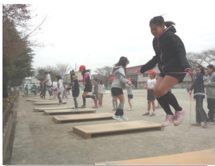
1月中旬 30分休み 校庭縄跳び補助板