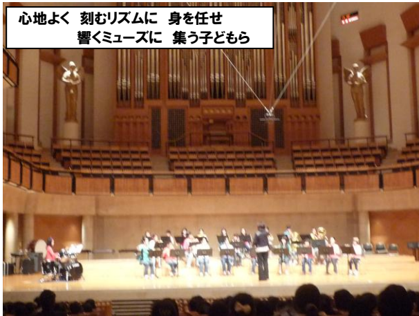
心地よく 刻むリズムに 身を任せ 響くミュージックに 集う子どもら