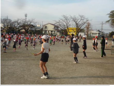
1/19 体育朝会 スポーツ委員の模範演技