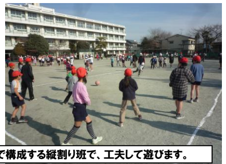
異学年で構成する縦割り班で、工夫して遊びます。