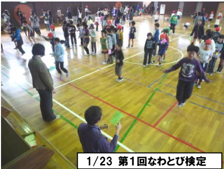
1/23 第1回なわとび検定