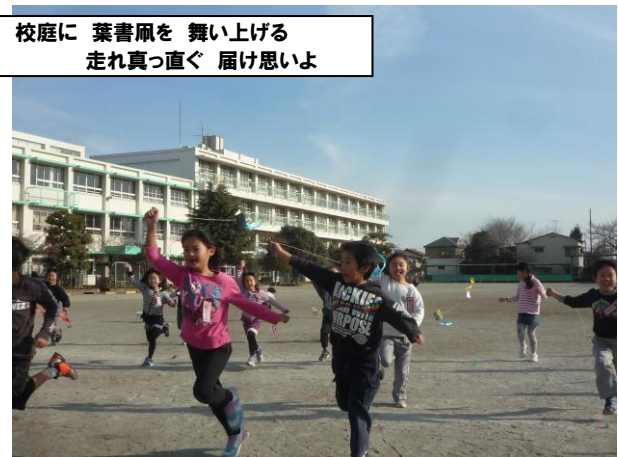
校庭に 葉書凧を 舞い上げる 走れ真っ直ぐ 届け思いよ