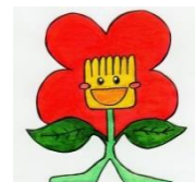
椿峰小マスコット ツバッキー

本年度も、トピックスのコーナーを中心に、椿峰小学校の日々の教育活動の様子をお知らせします。是非ご覧ください。尚、ホームページに載せる児童の写真については、サイズを小さくする、アップの写真は使わない、名札・作品等の個人名が写っているものは加工する等、一般の方には個人が特定できないよう配慮をしております。