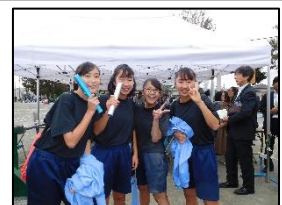
運動会で模範リレーを披露してくれた陸上部

椿峰小学校は、ほとんどの児童が上山口中学校へ進学します。小学校の卒業生がスムーズに中学校へ行けるように様々な連携の取組を行っています。運動会の中学校陸上部の模範リレー、英語の先生の小学校での外国語（英語）の授業、体育科の先生による集団行動の授業、教職員の合同研修会等を実施しています。今年度から新たな取組として、中学校の合唱コンクール金賞のクラス（今年度は1年生）が小学校の校内音楽会で合唱を披露します。