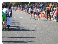
昨年の大会の様子

2月17日(日)所沢市小学校駅伝大会(スポーツ少年団交流大会と共催)が航空記念公園で行われます。各小学校1チーム(男女3名ずつ6名)出場します。(スポーツ少年団のチームで出場する子もいます)出場する選手たちは大会に向け毎日練習をしています。頑張ってくれると思いますので、応援をお願いします。